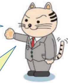
多摩市職員 にゃんともTAMA三郎

市が受動喫煙防止に関する総合的な施策を実施する責務について定めているほか、市民・事業者・施設等管理者の皆さんそれぞれが守るべき責務や、連携、協力について定めているにや。 自分自身や大切な人を守るため、まずは一人ひとりが受動喫煙への理解を深め、誰もに関係のあることだと認識することが大事にや。