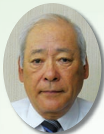
多摩市自治連合会 会長