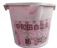
消火水確保用のバケツ

救命技能認定書の有効期間は3年ですが、多くの方が現在も継続しており、この18年間で延べ250名以上の参加を得ております。普通救命講習にはご夫婦での参加を推奨します。なぜなら、救命のお相手がいつも身近にいるからです。