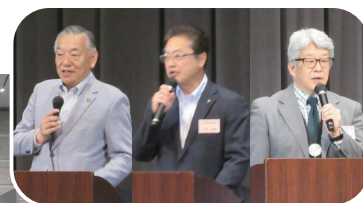
顧問の皆様よりご挨拶