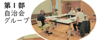
第1部 自治会 グループ

第1部の自治会グループでは、発災時の対応、訓練についての具体的な取組や高齢化に伴う対応の困難さについて話し合わせ、管理組合グループでは、管理組合と自主防災組織との関係や行政との関わり、避難所運営に関する課題、防災訓練の取組状況等について話し合われました。