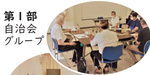
第1部 自治会 グループ

第1部の自治会グループでは、会長・理事・役員の手不足、自治会の加入率、役員会の開催形式、IT化などについて話し合わせ、管理組合グループでは、管理組合の運営や理事の選出、理事会の開催形式や回覧板などについて話し合われました。