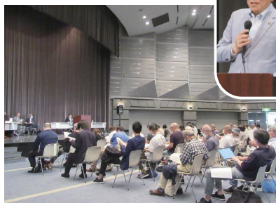
定期総会当日の様子