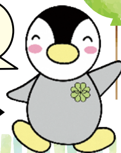
東京都民生委員・児童委員キャラクター「ミンジー」▶

民生委員活動に興味のある方は福祉総務課までお問い合わせください。まずは面談をして、活動内容をご説明します。