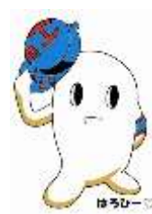
あいさつ運動キャラクター はろぴー♡