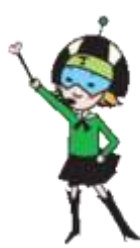
子宮がん検診 キャラクター