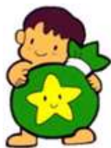
環境キャラクター エコロちゃん