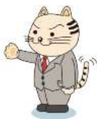
多摩市広報キャラクター にゃんともTAMA三郎