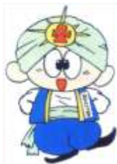
児童館キャラクター あそんじゃ王子