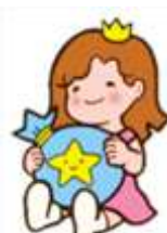
環境キャラクター エコミちゃん