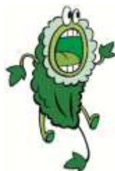
多摩市ユネスコス쿨の イメージキャラクター ゴーヤン