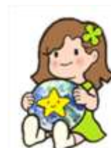
環境キャラクター エコアちゃん