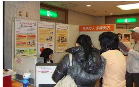
◇「東京ガスオリジナルクイズに 挑戦してみよう！」東京ガス 多摩支店)