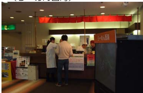
◇体にやさしい減塩ラーメン試食 (らーめん西海)