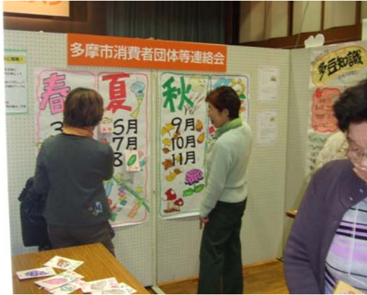
◇「旬」を学んでかしこい食卓 (多摩市消費者団体等連絡会)