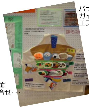
バランス ガイドの エプロン