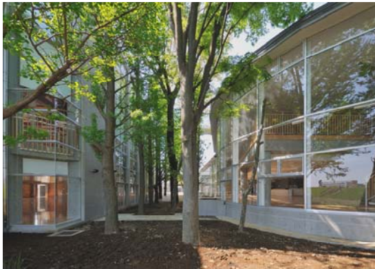
既存の樹木を残す