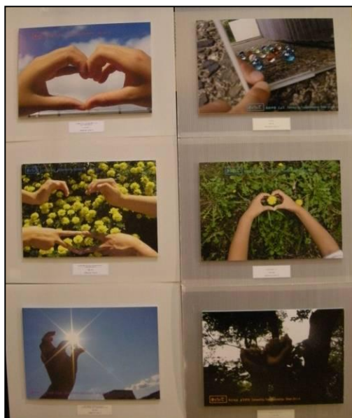
『きぼうのて』の作品の一部