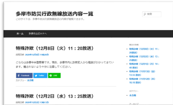
▲確認サイトイメージ