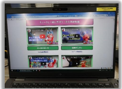
パソコンやスマホを活用！

コロナに負けず、防災を学ぼう！ 東京消防庁のホームページでは、楽しみながら防災について学べるよ！