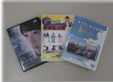
消防署で貸出ししています！