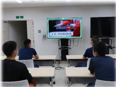
リモート防災学習のイメージ