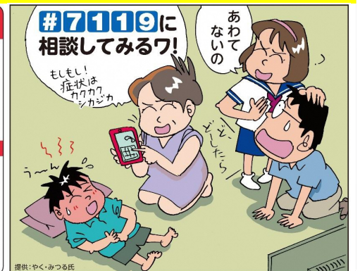
提供:やくみつる氏