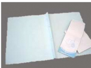
メモ用紙・紙製ファイル