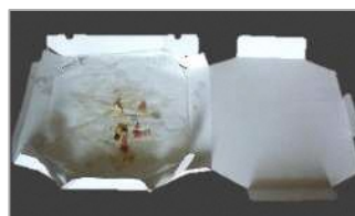
（食品残渣が付着した紙）