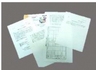
使用済みのコピー用紙