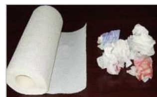
（使用済みペーパータオル）