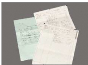
ダイレクトメール