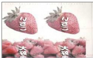
（使用済み昇華転写紙）