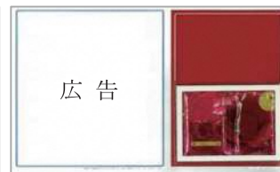
（シャンプー・香水など）