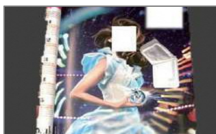
（香水試供品付の雑誌）