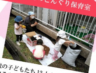
諏訪のどんぐり保育室

1、2歳の子どもたち12人の小さな保育室です。 ここで出る生ごみは、給食の食べ残しだけです。 1年前に講習会に出て、実践しています。 できた生ごみ堆肥を使って、プランターの古土を再生させ、 ミニトマトの苗を植えました。 子どもたちと、赤く実ったトマトを 味わうのが楽しみです。