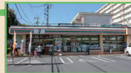
◀フロントガラスには断熱ガラスが使用されている