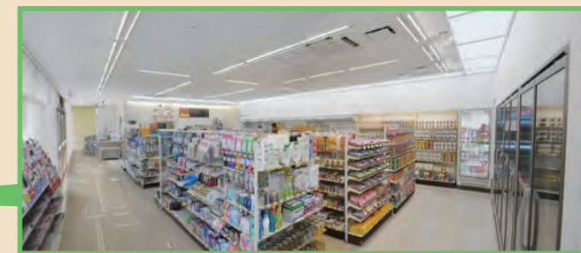
▲天窗から太陽光を取り入れている