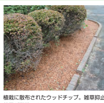
植栽に散布されたウッドチップ。雑草抑止効果が期待できる