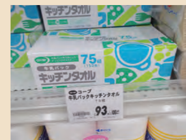
▲牛乳パック再生の紙タオル。再生品が購入されることでリサイクルの輪が完結する