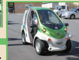
配達に使用する電気自動車「コムス」▶