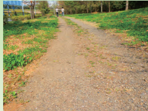
よこやまの道、ウッドチップ散布前