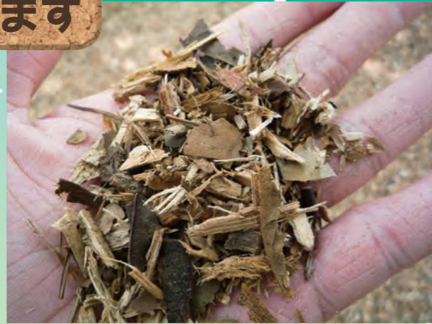
剪定枝を細かく砕いて作られるウッドチップ

みどりが豊かな多摩市では、みどりを管理する際に大量に発生する「草枝」の処理が長年の課題です。「ごみ」として焼却処分するのではなく、「資源」として位置づけ、エコプラザ多摩草枝資源化棟で、剪定枝をウッドチップに加工する取り組みを始めています。ウッドチップは、雑草抑止やクッション効果が期待できることから、市内公園の園路や遊具周り、中学校の植栽地に散布しています。