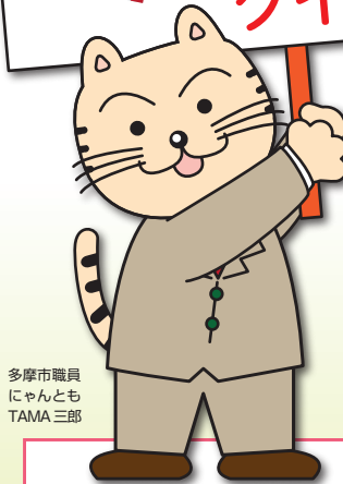
多摩市職員にやんとも TAMA三郎