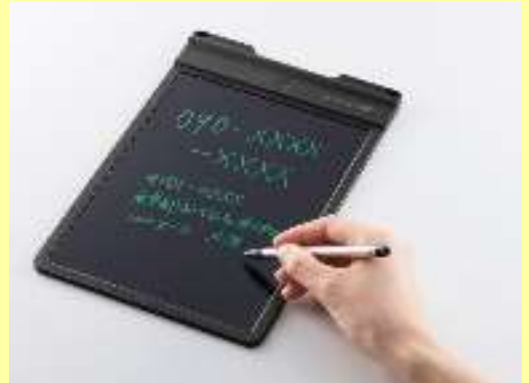
筆談ボード（電子式）