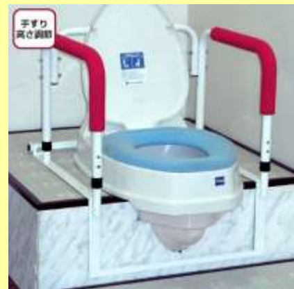
トイレの改修工事