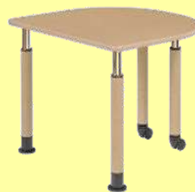
高さ可動式 テーブル