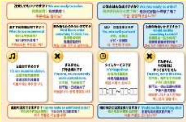
コミュニケーションボード