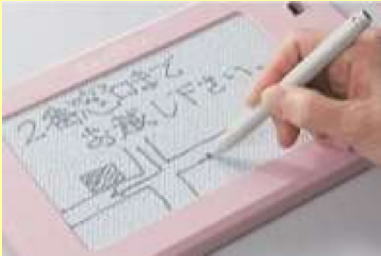
筆談ボード（アナログ式）