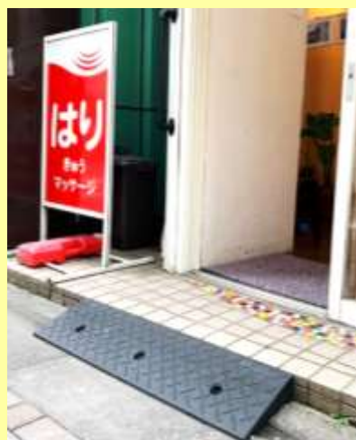
段差解消スロープ (折り畳み式スロープ)