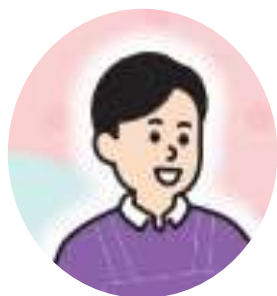
多摩市差別解消支援 地域協議会委員