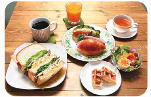
第3土曜限定！ モーニングは3種類。

看板メニューは、栄養&ボリューム満点の「こはるび定食」。手作り発酵調味料などを使った地場野菜たっぷりのおかずに、もちもち玄米ごはんと汁物付き。系列店「どんぐりパン」のクロワッサン生地を店内のワッフルメーカーで焼いた「クロワッフル」も人気です。