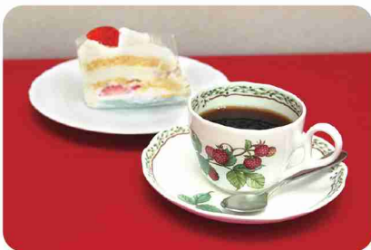
挽きたてのコーヒーをノリタケのカップで。