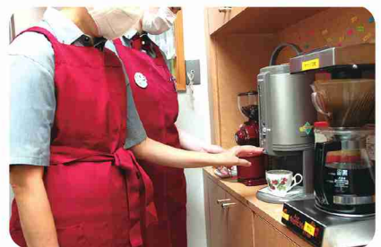
コーヒーは、淹れる直前に豆を挽いています。