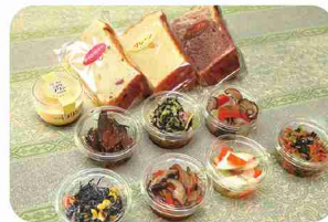
種類豊富なお惣菜とシフォンケーキ。

無農薬・減農薬食材で作られた系列店等の料理が一堂に会い、惣菜やお弁当に。看板メニューは旬の野菜たっぷりのプレミアムカレーです。30種類以上のスパイスで水を使わずに作るので、素材の旨味が濃縮されコクがあります。おいしいごはんにもこだわり、茨城県の生産者から減農薬米を直接仕入れています。季節の味が楽しめるシフォンケーキや、果物と野菜のフレッシュジュース&ノンアルコールカクテル、直営農園「夢畑」でとれた野菜も販売。