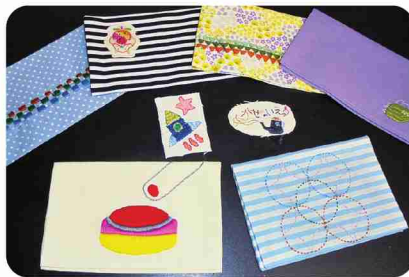
個性的で緻密な刺繍は、図案も通所者が。

温もりあふれる内装がおしゃれな、居心地のよいカフェ。自家製ソーセージは、国産のひき肉で一から手作りにしているこだわりの一品です。腸詰め作業は2人1組で。皮は破れやすく、均等な太さ・長さにするにはコツが。息の合ったコンビネーションも不可欠です。巧みな技で作られる自家製ソーセージは、パンやごはんとのセットメニューがランチにぴったり。ほかにも日替わりランチやガバオライスがあり、テイクアウトも可能です。ドリンクのイチオシは自家焙煎コーヒー。自家焙煎コーヒーゼリーも、デザートやおやつタイムに人気です。ほかにも「しごとば」で、パソコン解体や封入などの軽作業、刺繍雑貨の製作も行っています。雑貨はカフェ店内で購入可能です。