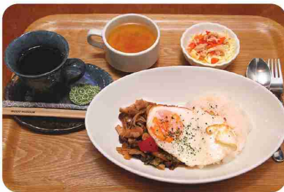
マイルドな味で人気のガバオライス。