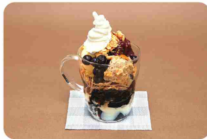
旬のフルーツが味わえるパフェなどのスイーツも充実。

大切にしているのは、お客さまとの対話。冬のおにぎりセットに野菜たっぷりの豚汁を付けたのも、お客さまとの何気ない会話がきっかけです。軽食すべてに自家製ビクルスが付くのもうれしいところ。手作りにこだわり、パフェのコンフォートも店内で。「友愛珈琲店」直伝のおいしいコーヒーで、心穏やかなひとときを。