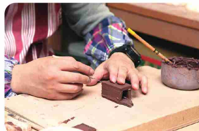
バリエーション豊かな手工芸品を笑顔で楽しく製作。