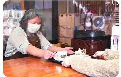
自分の「無理」がわかることを目標に働いています。