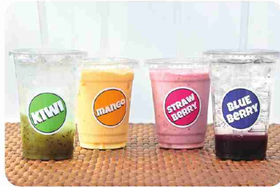
果肉の甘みが引き立つ、すっきりとした口当たり。