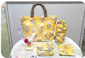
多種類の商品が、同柄での製作も。