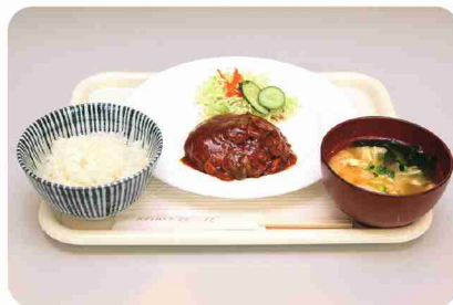
「ハンバーグ定食」や「お豆腐屋さん定食」が人気。