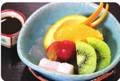
うさぎ形に飾り切りしたオレンジも通所者が！