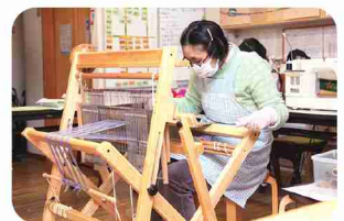
糸選びから織り上げまで担当します。

木の温もりあふれる店内に並ぶ、色とりどりの織製品やフェルト小物は、すべて奥の工房での手作りです。織物は、ルールと正確さが重要な従来の手法ではなく、心のまま自由に織る「さをり織」。色選びや素材選び、織るときの力加減など、作り手の個性や気持ちで仕上がりが一変し、アート作品のような魅力があります。裂いた古布を紐状にして織る「裂き織」も多く、どれも温かみを感じさせるものばかり。織製品のほか寄付された古本や古布も販売しています。