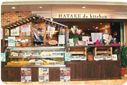
店頭販売スペースは、農園のログハウスのような雰囲気。