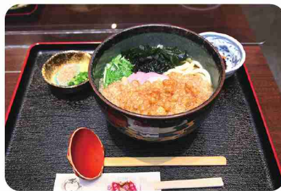
マイタケ香る揚げ玉が格別な「ほんぼこうどん」。