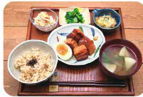
メニューは日替わり！「こはるび定食」。