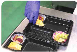
量を均等にするのが難しいところ。

「日替わり弁当」は季節感のある新メニューが毎月登場。ぜひご賞味いただきたいのが魚を使ったこだわりメニュー。西京味噌も店内手作りで。 「日替わり丼」も人気。店内での飲食も可能です。クッキーやパウンドケーキなど焼菓子も製造・販売しています。