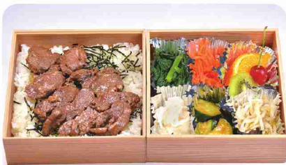
予算に合わせたオーダーメイド弁当も予約可能。