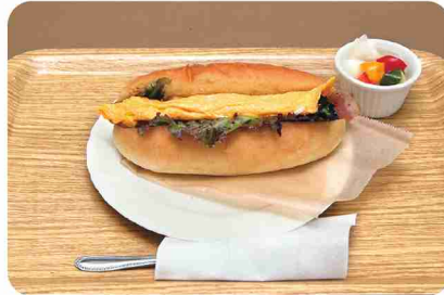
ボリュームーな「コッパン」も系列作業所で手作り。