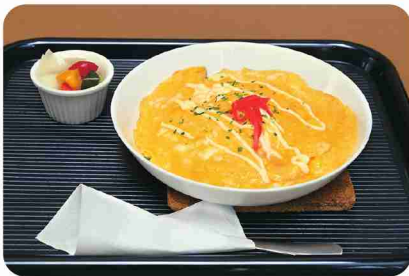
ふわわり玉子をのせた「和風オムライス」は高菜入り。