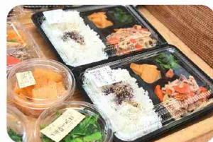
日替わり弁当は2サイズ。

全国から集めたこだわりの産直品や地場野菜が並ぶ、自然食品店。店舗2Fで作るお惣菜やお弁当は、やさしい味わいです。メニューは入荷食材次第で毎日変わります。定期購入や予約販売、外販も。系列店「はらっば」では、「あしたや みどり」の商品も購入できます。