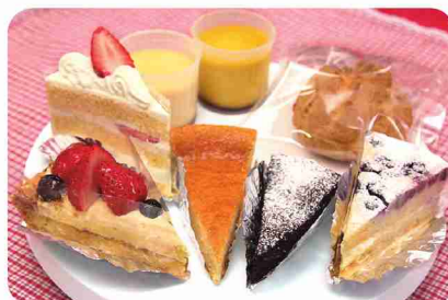
生ケーキは季節や日により変わります。お楽しみに！

挽きたてのコーヒーがおいしいカフェ。コーヒーにぴったりの「菓子工房れすと」のケーキや焼菓子も提供。「あらいぐまラスカル」のマンホールプリントクッキーは多摩のお土産に。隣接の関戸公民館で配布されるマンホールカードを目当てにやってくる人にも人気。お昼時は日替わり定食や軽食を注文する人々が賑わいます。