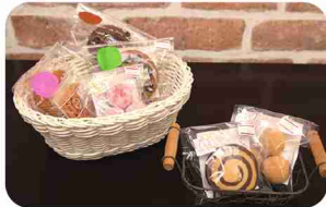
季節限定スイーツもお楽しみに！

「日替わり弁当」は季節感のある新メニューが毎月登場。ぜひご賞味いただきたいのが魚を使ったこだわりメニュー。西京味噌も店内手作りで。 「日替わり丼」も人気。店内での飲食も可能です。クッキーやパウンドケーキなど焼菓子も製造・販売しています。