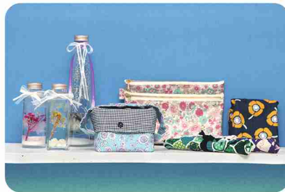
各々が好みと個性をいかして作る、ハンドメイド品。

隣り合う2店舗は、ドリンク&手作り品のお店とリサイクルショップ。放課後等デイサービス卒業後、笑顔で働ける居場所作りのためオープンしました。ドリンク店は、晴れやかな気分になれる海をイメージした内装。美容・健康面でも注目される水素水を使ったドリンクは、果肉ソーダやスムージー、ティーソーダなど20種類以上。氷も水素水で作っています。濃厚なソフトクリームは、バニラと季節のおススメの2種類。ハーバリウムや布ポーチなどの手作り品も並びます。手作りミニオーナメントをカプセルトイにして販売するなど、ユニークな商品も。バラエティ豊かなリサイクルショップの商品はすべて寄付品。クリーニングして販売するほか、商品にできないものは解体作業へ。