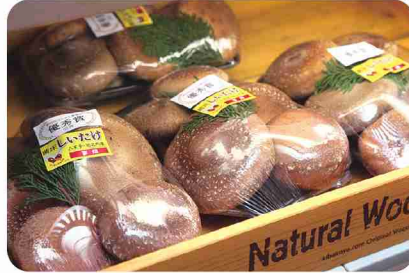
「夢畑」産の野菜を販売。濃厚な味の肉厚しいたけも！

丁寧な調理で素材そのものの味を引き出し、野菜をふんだんに使った料理を提供。使っているのは、系列農園「夢畑」から届くとれたて地場野菜や、提携農園の無農薬・減農薬野菜です。平日の日替わり定食はもちろん、どのメニューにもたくさんの小鉢が付くのが特徴。味付けや調理法を変え、同じ野菜でも目新しさを感じられるよう工夫。小鉢の調理は通所者も担当するため、作りやすいレシピの考案と指導に力を入れています。具たくさんの汁物は栄養満点で、野菜の旨味がたっぷり。甘味が強く、家庭の味に近いやさしい味わいです。主菜や副菜も親しみやすい味の料理になるように、メニュー作りをしているそう。心も体もホッとさせる素敵な料理をいただけます。