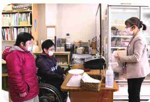
調理から接客まで業務はさまざま。