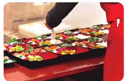
調理のほかにラベルシール添付や接客なども。