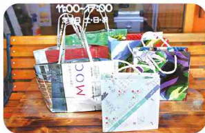
チラシで作ったエコな紙袋を使用。

オープン当初から変わらない、優しい甘さとバターの香りが特徴のマドレーヌとパウンドケーキ。「夏みかんのパウンドケーキ」に使っている手作りピールは、カットや皮むきなどすべてメンバーの手作り。焼菓子のおいしさで元気になれるよう、丁寧に作り上げています。