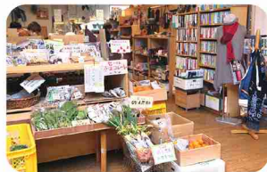
食品も織製品も一度に揃う！

全国から集めたこだわりの産直品や地場野菜が並ぶ、自然食品店。店舗2Fで作るお惣菜やお弁当は、やさしい味わいです。メニューは入荷食材次第で毎日変わります。定期購入や予約販売、外販も。系列店「はらっば」では、「あしたや みどり」の商品も購入できます。