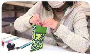
商品が売れると、喜びと自信に！

海外のカーテン生地など、希少な生地で作った商品も多数。商品は店舗奥の工房で製作。通所者が自分のペースで働けるよう、裁断から完成まで一人で担当します。作業しやすいようパーツ数を減らすなどデザインや作り方を工夫。好みの布でのオーダーメイドもOKです。