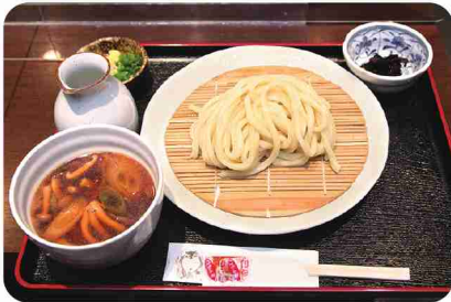
きのこネギの旨味たっぷり！「つけ汁のこうどん」。