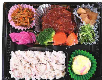
主菜1種(写真は肉)、副菜4品の日替わり弁当。

薬による体重増加した人の悩みをきっかけにオープン。体にいいものを使い、手作りすることにこだわっています。人気のあんみつは、寒天だけでなく、あんこ、求肥、黒みつまですべて手作り。現在は店内飲食を中止し、「ナチュラルショップ遊夢」でお弁当などを販売。寒天を混ぜた低カロリーごはんが特徴です。