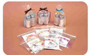
粉せっけんやビーズプレスレットも。

メンバーたちの個性とチームワークが最大の魅力。「アクリル布巾」は、高齢者にも絞りやすいよう薄手のタオルを使い、アクリル毛糸で楽しい絵柄をカラフルにステッチしています。粉せっけんは、かわいい容器に入れて携帯用に。運びやすく防災グッズとしてもおすすめ。