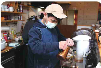
じっくり淹れる自家焙煎コーヒーは、香り豊か。