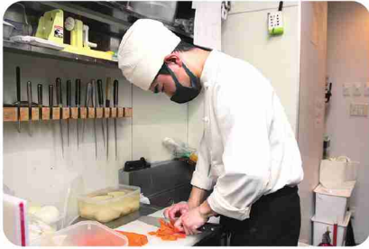
プロを目指す人も、必要なスキルをしっかりと学べます。