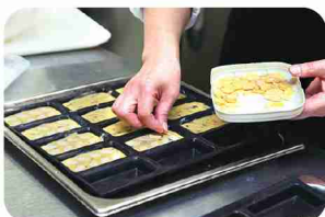
助け合うことで作業がスムーズに。