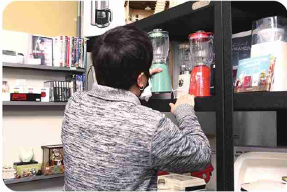
裏方作業はもちろん、店内の清掃や接客も担当。