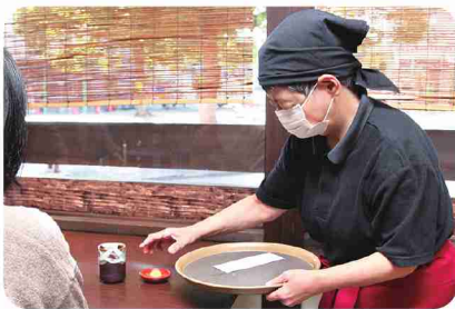
お茶と一緒にクッキーのサービスも！