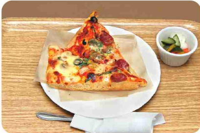
チーズたっぷり！ふっくら生地「MIXピザ」。