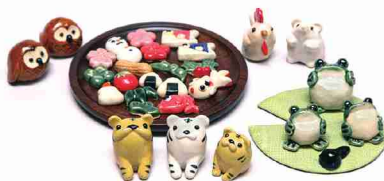
縁起物として好評のカエルの置物や、干支の置物も。