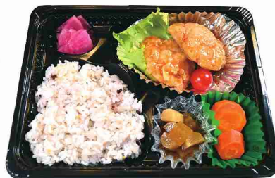
主菜1種(写真は魚)、副菜2品の日替わり弁当。