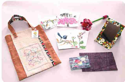
着物を洗ってほどいて反物にしてから製品を作ります。