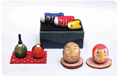
大切に作った作品が売れることがやりに。

さまざまな手工芸品を販売。なかでも最近のヒット商品は、おうち形の一輪挿しと爪楊枝入れ。「実用的でインテリア性のある陶芸品」をコンセプトに作られました。刺子のエコバッグや、季節感あふれる張子の置物も製作。発送準備も通所者が。心のこもった大切な作品を、丁寧に梱包して送り出しています。