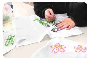
アクリル毛糸でタオルにステッチ。