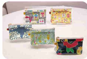
クリアポケットにシルバーバースも可！

海外のカーテン生地など、希少な生地で作った商品も多数。商品は店舗奥の工房で製作。通所者が自分のペースで働けるよう、裁断から完成まで一人で担当します。作業しやすいようパーツ数を減らすなどデザインや作り方を工夫。好みの布でのオーダーメイドもOKです。