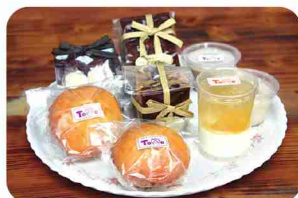
商品ラベルのカットも作業のひとつ。

オープン当初から変わらない、優しい甘さとバターの香りが特徴のマドレーヌとパウンドケーキ。「夏みかんのパウンドケーキ」に使っている手作りピールは、カットや皮むきなどすべてメンバーの手作り。焼菓子のおいしさで元気になれるよう、丁寧に作り上げています。