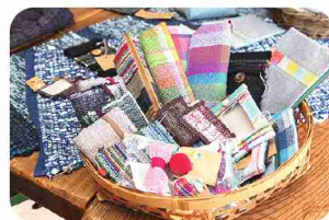
独創的な色や素材の織製品がずらり。