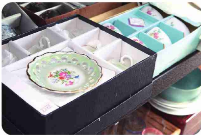
商品はすべて寄付品。食器セットは人気商品です。