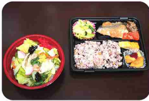
利用者と職員の協働作業で完成！