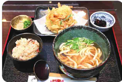
ビッグなかき揚げ、かやくごはん付き「よくばりセット」。

昔、多摩村の農家では、慶弔の集まりなどの際にうどんを振る舞う風習があったそう。この文化を大切にしたいとオープンしたお店。駅から少し離れた場所にあるため、「また行きたい」と思っていただけの丁寧な接客を心がけています。多摩市産の地粉をプラスした麺は、コシがあり歯ごたえ強め。創業のきっかけとなった「多摩うどん」をイメージしたメニューは「つけ汁のこうどん」。濃いめのつけ汁は、炒めたきのこネギの旨味がたっぷり。イチオシは、賄いから生まれたボリューム満点の「よくばりセット」。1日10食限定で午前中に完売してしまうことも多いそう。揚げ玉にもおいしさの秘密が。カットしたマイタケが混ぜ込まれています。全うどん小鉢付きです。