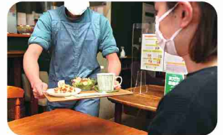
それぞれが得意な分野で、能力を発揮。

看板メニューは、栄養&ボリューム満点の「こはるび定食」。手作り発酵調味料などを使った地場野菜たっぷりのおかずに、もちもち玄米ごはんと汁物付き。系列店「どんぐりパン」のクロワッサン生地を店内のワッフルメーカーで焼いた「クロワッフル」も人気です。