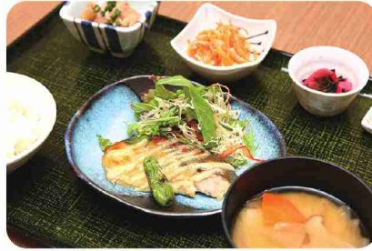
ヘルシーな日替わり定食。魚もお肉も一度に楽しめます。