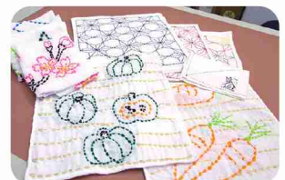
各々が好みの絵柄で楽しく作成！

メンバーたちの個性とチームワークが最大の魅力。「アクリル布巾」は、高齢者にも絞りやすいよう薄手のタオルを使い、アクリル毛糸で楽しい絵柄をカラフルにステッチしています。粉せっけんは、かわいい容器に入れて携帯用に。運びやすく防災グッズとしてもおすすめ。