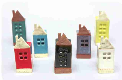
たくさん並ぶと、まるでヨーロッパのまちみたい！