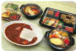
系列店の料理をお惣菜やお弁当に。