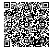
▲文部科学省 HP (文部科学省作成のリーフレット)