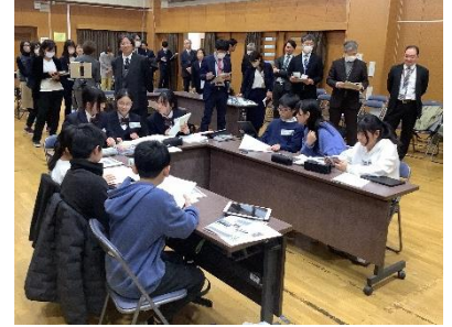
※当日の様子は、YouTubeの多摩市公式チャンネルにて後日配信します