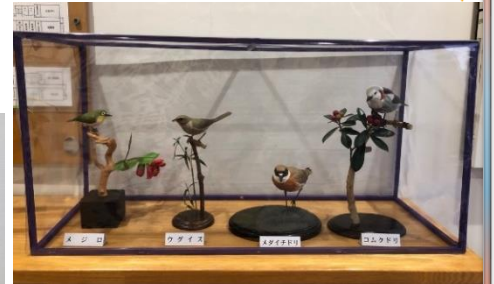
▲東寺方小学校の展示の様子