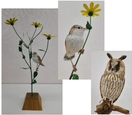
▲寄贈していただいた作品の一部を紹介