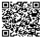
▲地域学校協働活動については市公式 HP へ