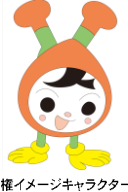
人権イメージキャラクター 人KENまる君