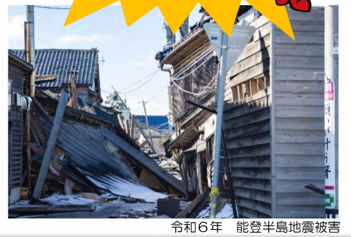
令和6年 能登半島地震被害