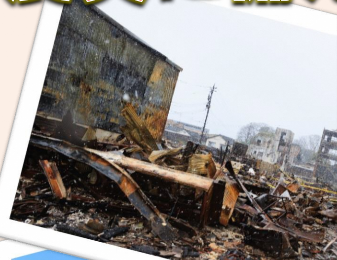
令和6年 能登半島地震被害