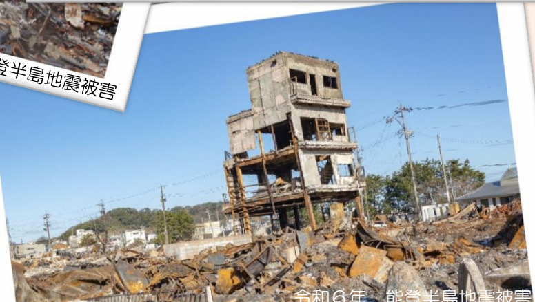
令和6年 能登半島地震被害