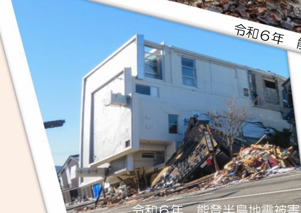
令和6年 能登半島地震被害