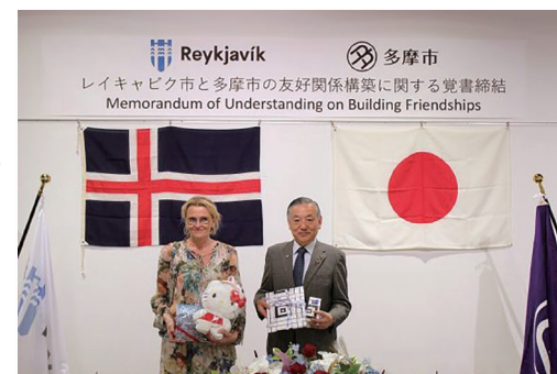
覚書締結式の様子 お互いにプレゼントを交換