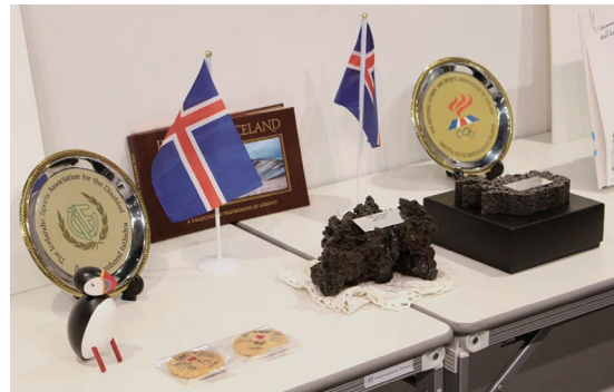
アイスランド国旗とアイスランドを代表する鳥「パフィン」の置物

今後もアイスランド大使館との交流に加え、レイキャビク市民との交流を進め、一層アイスランドを身近に感じる機会を作っていきます。