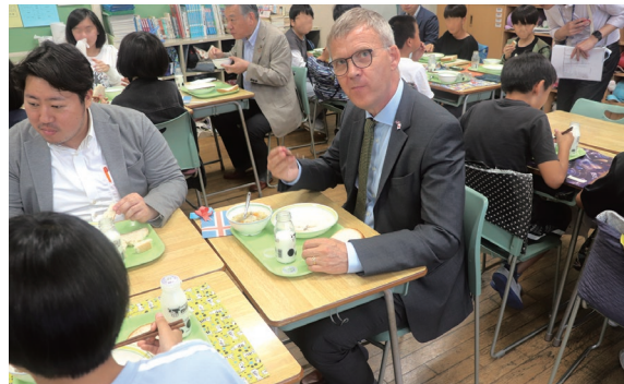
市内小中学校で児童とともにアイスランド料理の給食を食べる駐日アイスランド大使（当時）