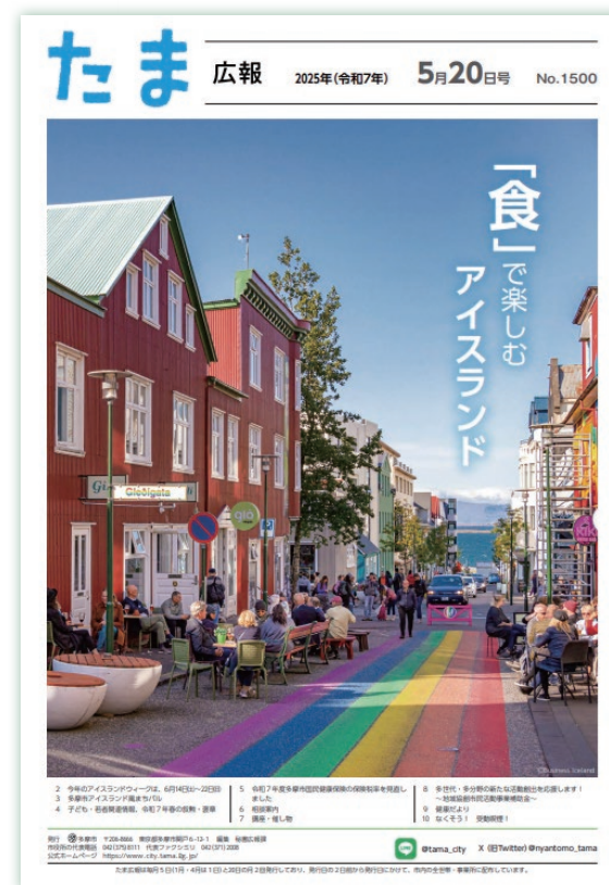
注1 たま広報(令和7年5月20日号)

そして、そのすぐあとに世界初の女性大統領がアイスランドで誕生しました。まさにストライキの成果です。