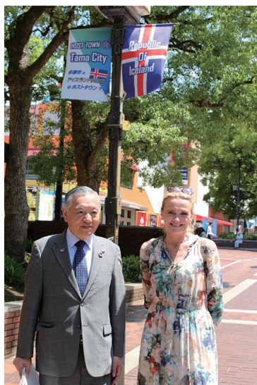
多摩センターを視察する様子

これからも、文化的なことなど、様々に相互理解を深めていき、双方の発展のために取り組んでいきたいと思っています。この度の覚書の締結をとても良い機会ととらえています。