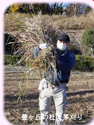
豊ヶ丘の杜で茅刈り