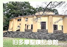
旧多摩聖蹟記念館