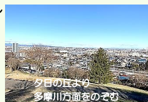
夕日の丘より多摩川方面をのぞむ