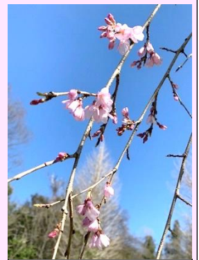
宇宙桜（三春滝桜） 咲き始め 3/27 撮影

今年は連光寺周辺も桜の開花が例年より遅く、4月上旬にもきれいな桜を楽しむことができそうです。春の訪れを感じながら、のんびりお花見散歩を楽しんでみませんか？