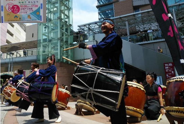
さくら広場：せいせき鼓桜による太鼓演奏