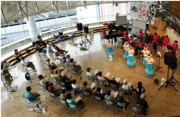
市民ロビー：Foreverの演奏とフラダンス