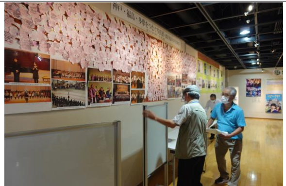
ギャラリー：団体の活動紹介パネル・ポスター展示

文章やイラストをかくのが好き、パソコンが得意などなど、自分たちの手で楽しい紙面を作ってみませんか？興味をお持ちの方は、ぜひ公民館までご連絡ください。