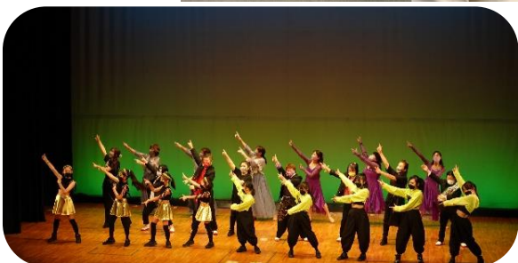
ヴィータホール：Cloverのダンスパフォーマンス