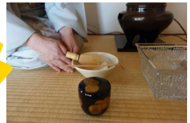
茶室：多摩市茶道連盟による「茶室をのぞいてみませんか」