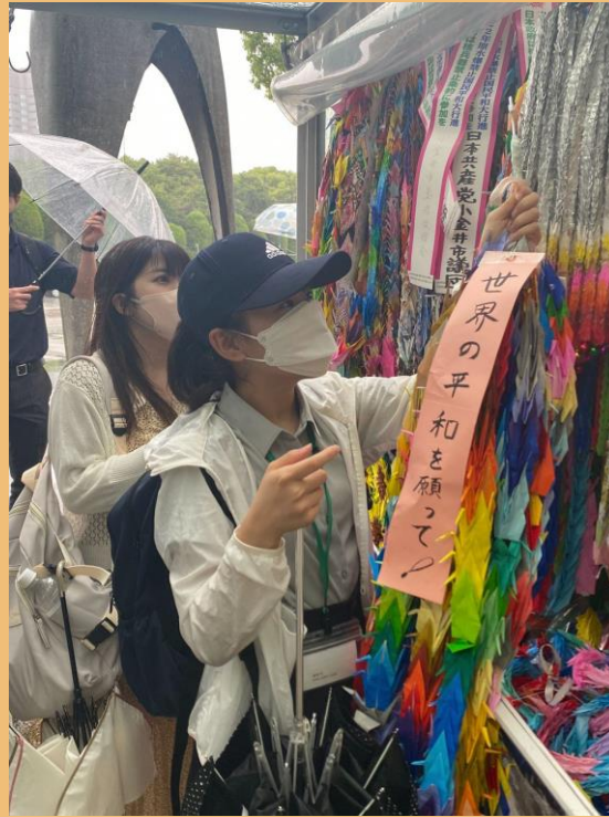
原爆の子の像の前で千羽鶴を 献納する派遣員