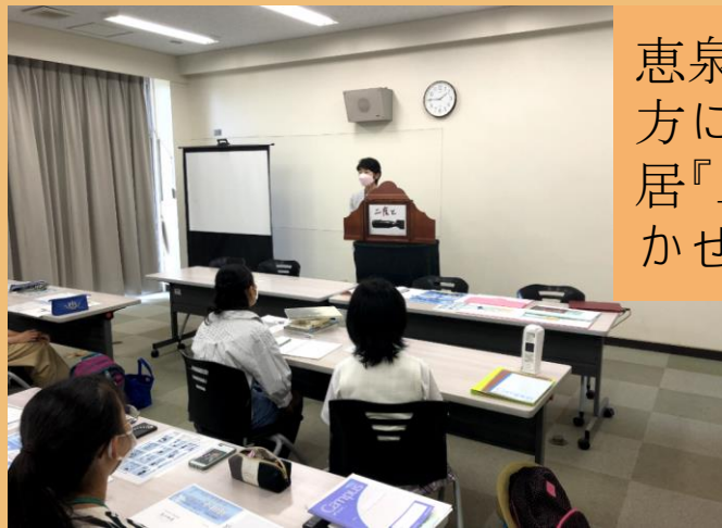
恵泉女学園大学の方による平和紙芝居『二度と』読み聞かせ