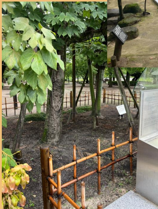
被爆したアオギリの木