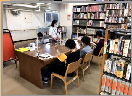
調べ学習in多摩市立図書館