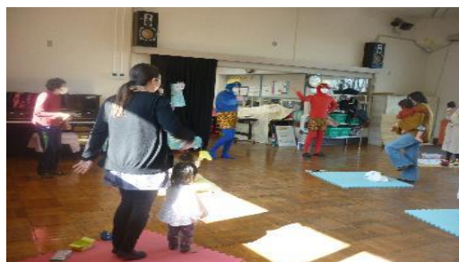
ちびっこたいむ 「節分」