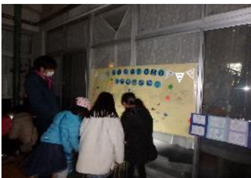
SORATOMO～冬の星座を見よう～