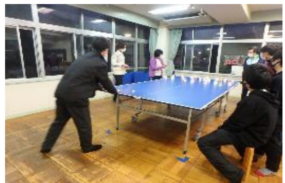
中高生 進級&卒業お祝い会