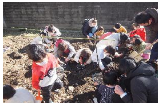
自給自足 カレー大作戦