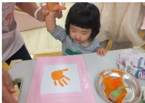
50周年イベントタイムカプセル手形