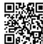
愛宕児童館二次元コード

コロナ禍でも利用者が安心して楽しめるように感染防止対策を講じてきました。また、過ごし方を選択できるように子どもたちの意見を取り入れ、バリエーションに富んだ遊びを提供しました。