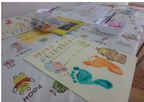
子育て支援講座 「ハーフバースデーをお祝いしましょう!」