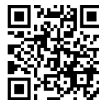
豊ヶ丘児童館二次元コード

子どもたちが児童館でやりたいことをなるべく実現しようとみんなからたくさん話を聞き、南国風カフェやカブトムシの家を作成したり、バンパー大会を実施しました。