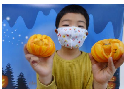
ジャックオーランタン