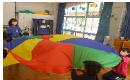
幼児のつどい「はとぼっぽ」