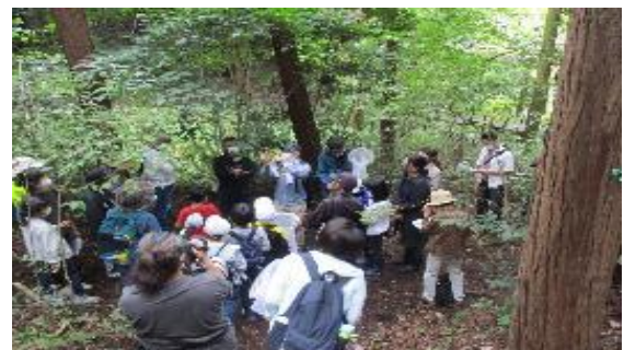
植物・昆虫観察会