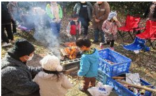
親子でたき火あそび&ちよこつと防災