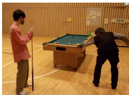
ティーンズビリヤード