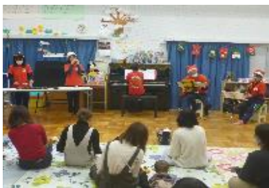
0歳児のつどい「ひなたぼっこ」 クリスマス会