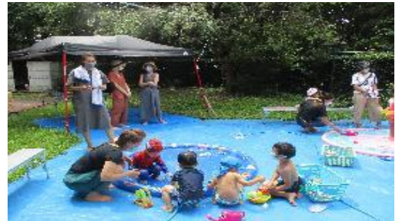
みずあそびひろば