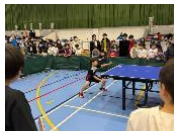
はちたま杯卓球大会 決勝の様子

いつも練習している児童館の遊戯室とは違い、広い体育館の緊張感のある試合会場で子どもたちは勇気をもって一生懸命取り組んでいる姿が見られました。またチーム戦では仲間の試合の応援にも熱が入りチームワークの大切さを感じられる大会となりました。