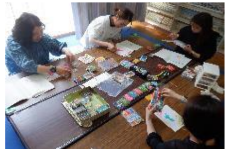
「手形足形をとろう」 一ノ宮児童館