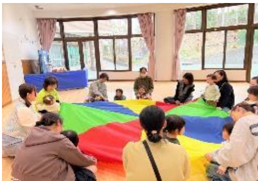
ふれあいリトミック