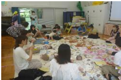
幼児のつどい 「ひなたぼっこ 栄養士さんのお話」