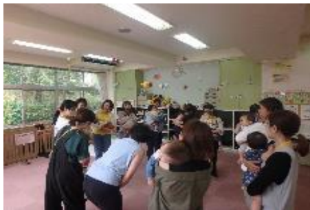
「親子でリフレッシュ体操」 永山児童館