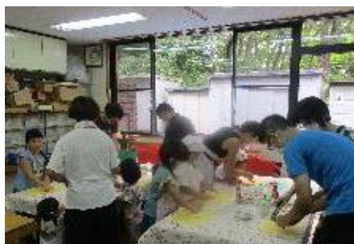
ドラム缶ピザづくり