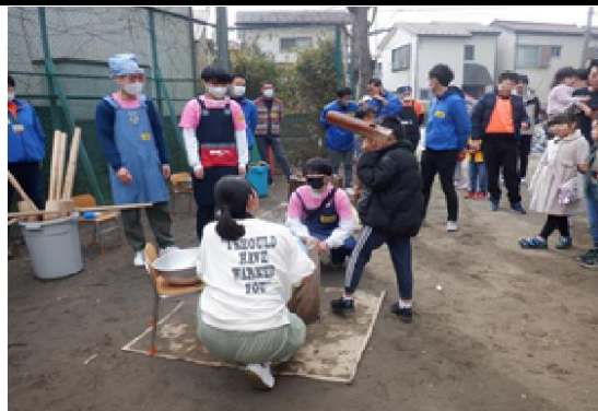
けやきっず「もちつき大会」