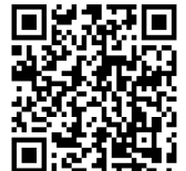
連光寺児童館二次元コード

リニューアルから1年がたち以前実施していた連光寺地区ならではの事業を復活させていきました。聖ヶ丘地域への移動児童館も毎月実施しています。