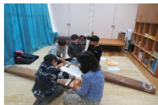
おこことをひいてみよう！