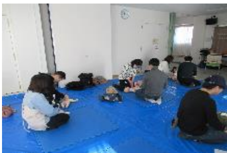
「0歳児のための救急救命講座」 連光寺児童館