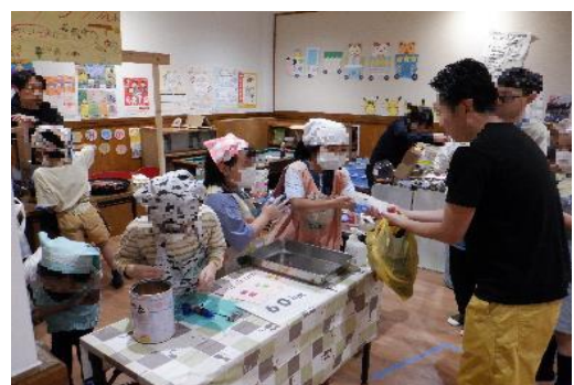
わいわいマーケット