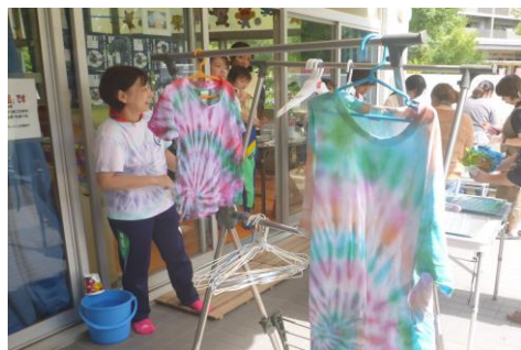
「やってみよう！染め物体験♪」 (諏訪児童館)

乳幼児の保護者が子育ての不安を解消したり、リフレッシュしたりする機会として月1回以上「子育て講座」を実施しています。以下は講座の様子の一例です。その他の取り組みは、「2. 各館の事業内容」を参照してください。