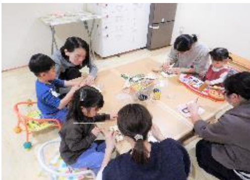
革のキーホルダーづくり