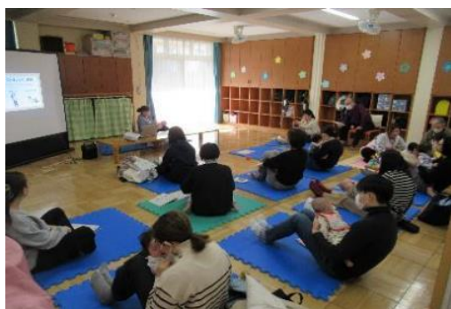
すくすく発達相談「親子・からだあそび」