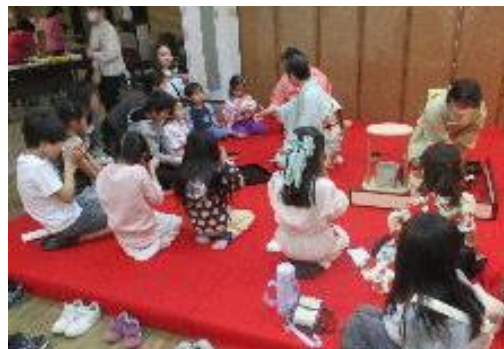
ゆうのたのしいひなまつり