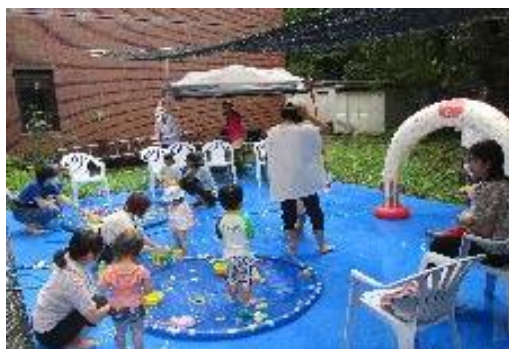
みずあそびひろば