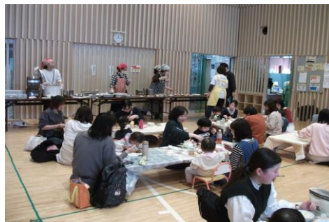
「ほっこりキッチン」 (唐木田児童館)