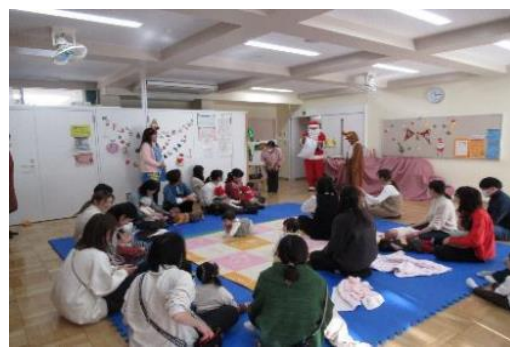
あかちゃんといっしょ「ラウンドスプーン」