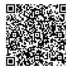
諏訪児童館二次元コード

諏訪児童館はスポーツを通じた交流に力を入れてきました。特に卓球は伝統的に学年を超えた交流があります。中高生が小学生に教える場面が日常的にあり、その積み重ねが実を結び、今年の「はちたま杯卓球大会」で優勝を果たしました。