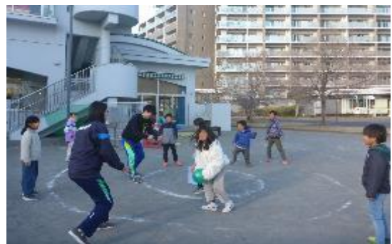
みんなであそぼ「サークルバスケット」