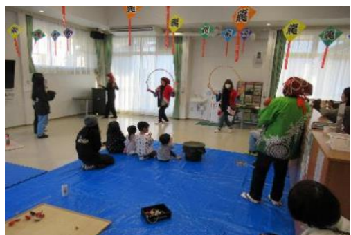
新春！昔あそびと伝統芸能をたのしもう！