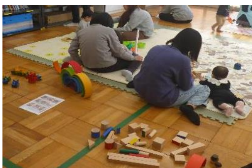
出張そらいろひろば