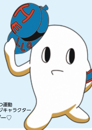
あいさつ運動 イメージキャラクター はろびー♡

地域でお互いにあいさつを交 わし合える人と 人の輪が広がっ ていくことを目 指しています。