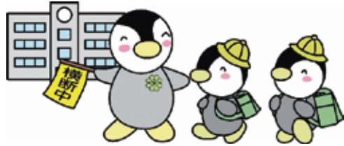
東京都民生委員・児童委員キャラクター ミンジー