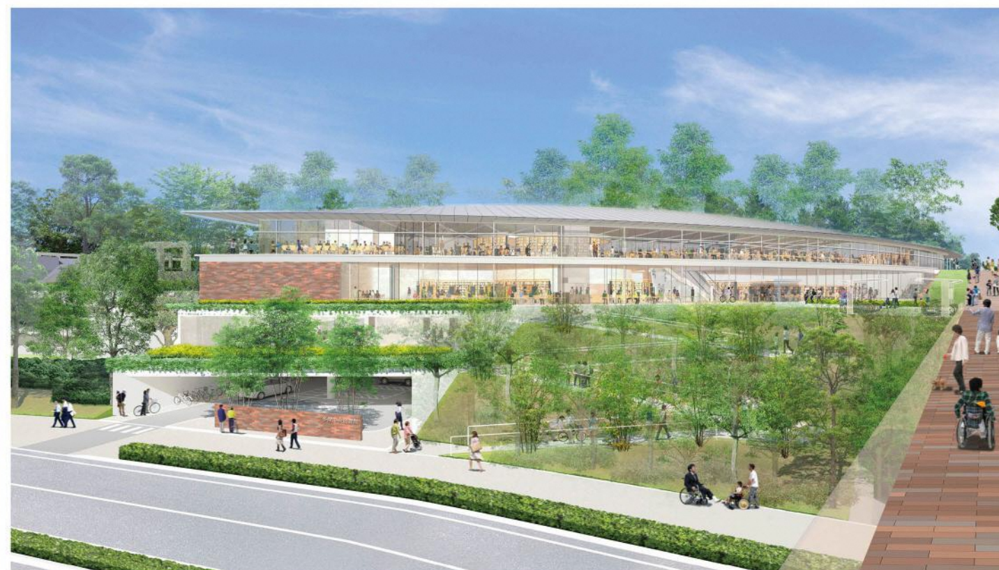
図4-1 レンガ坂から見える図書館イメージ