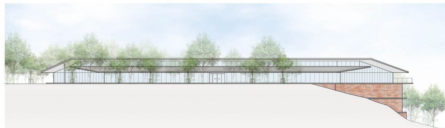
東立面図（多摩中央公園側から）