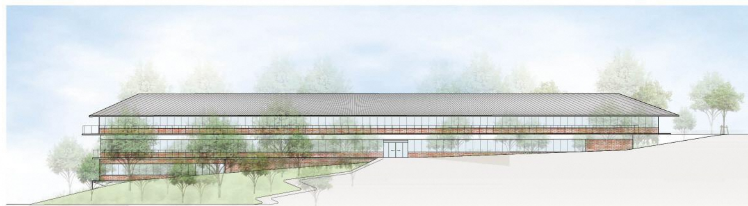
西立面図（レンガ坂側から）