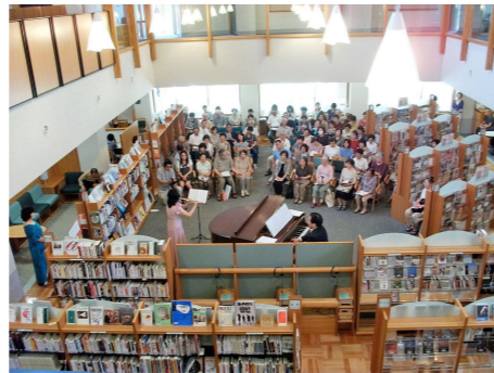
ひろば型の開架室でイベントコンサート

◎ トピックス： 公共施設の見直し方針の目的は、 安心して暮らし続けられるまちを目指し、 取り組みが本格的に始まります