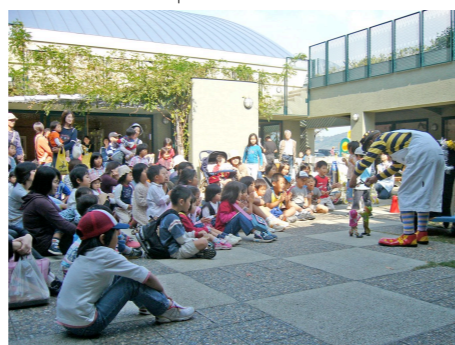
図書館の中庭ひろばでボランティアが人形劇

本に出会い、ものに出会い、人に出会い、自分確かめる。ひとりふと我に返る環境。緑陰の読書テラスのイメージ