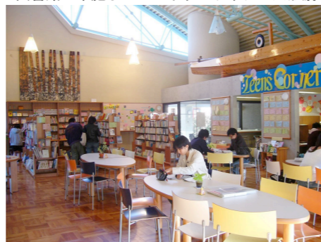
ティーンズのたまり場、ラーニングcommons