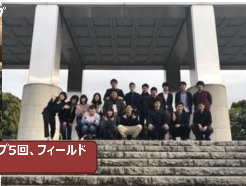
ワークショップ5回、フィールドワーク1回