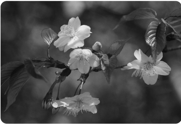
市の花 ヤマザクラ