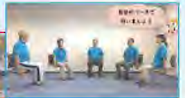
自宅でできる運動