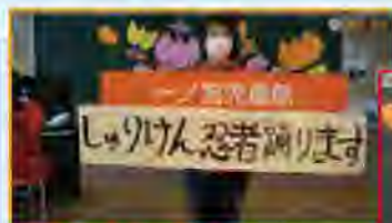
ダンス・赤ちゃん体操