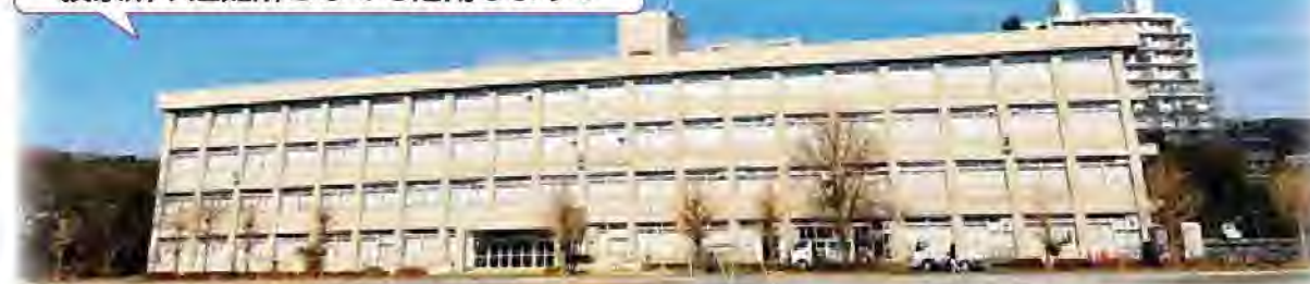
改修後の旧北貝取小学校