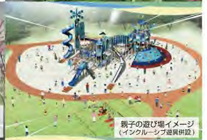
親子の遊び場イメージ (インクルーシブ遊具併設)