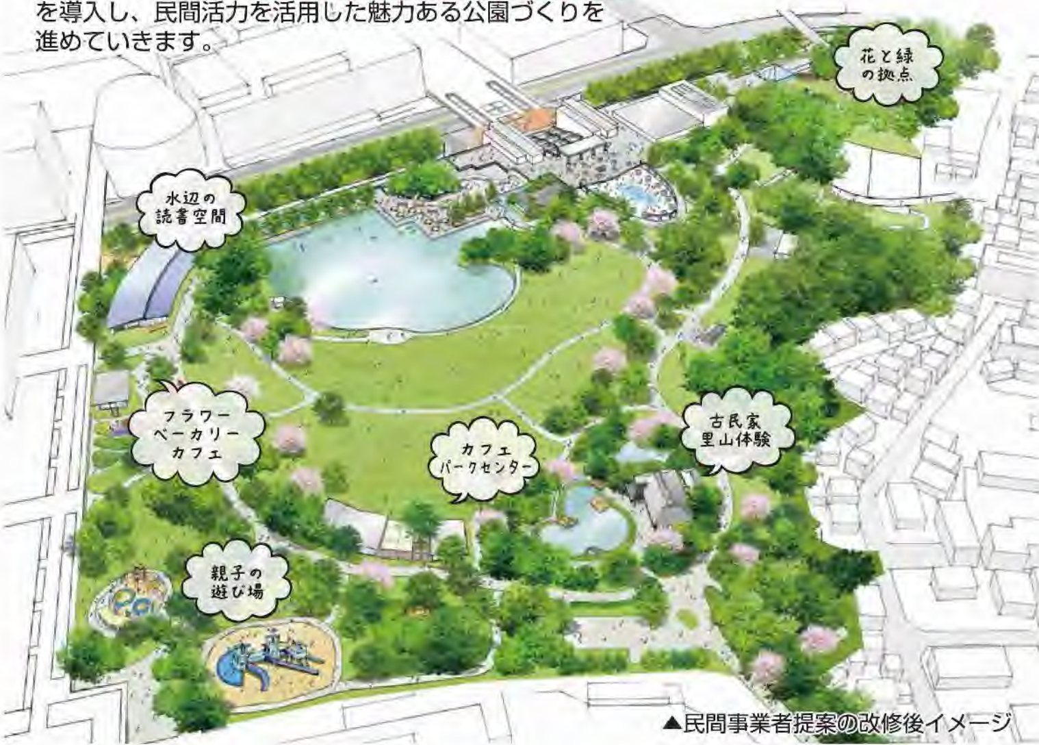
▲民間事業者提案の改修後イメージ

多摩中央公園では、公募設置等管理制度 (Park-PFI) を導入し、民間活力を活用した魅力ある公園づくりを進めていきます。