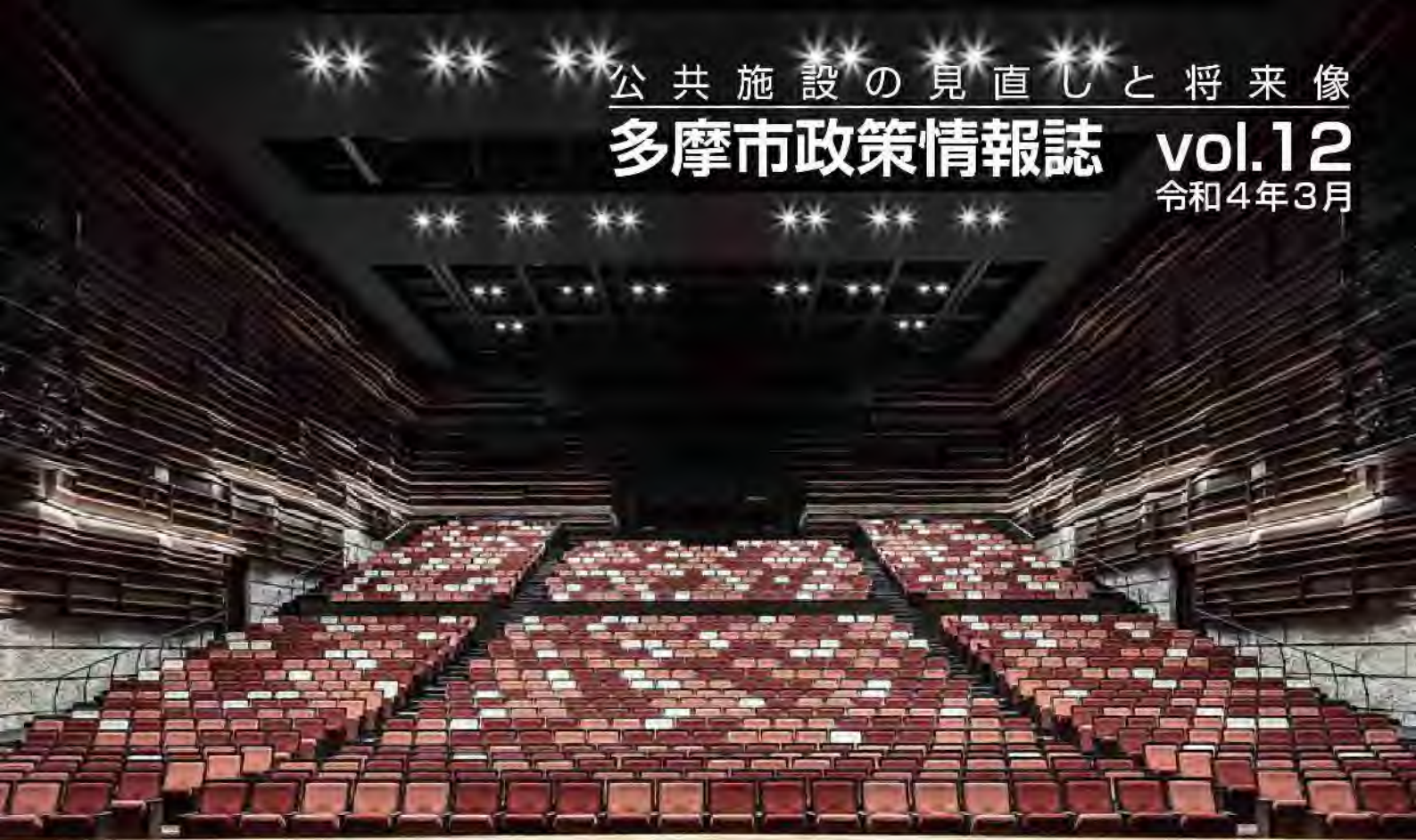
リニューアル後のパルテノン多摩大ホール