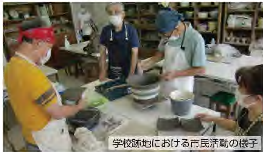
学校跡地における市民活動の様子

多摩ふるさと資料館 は、多摩市所蔵の様々な文化財に触れられる体験型展示施設です。