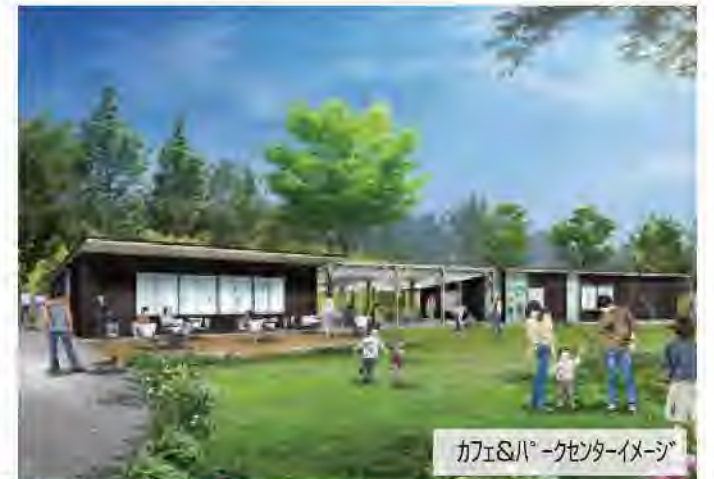
カフェ&パークセンターイメージ

事業者から、「市民や事業者が主体となって場づくりを行う」、「やってみよう!」を実現する公園ルールをみんなでつくる」など誰もが楽しめる公園にするためのアイデアが提案されました。