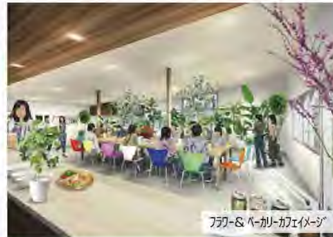
フラワー&ベーカリーカフェイメージ