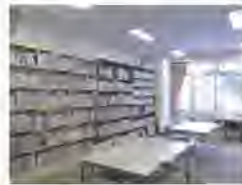
現在の図書館本館

多摩市では、多摩市民のめざす図書館や、図書館本館がめざす役割等をまとめた「多摩市立図書館本館再構築基本構想」を平成29年3月に策定しました。