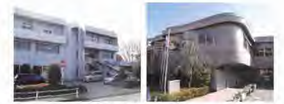
東寺方図書館 唐木田図書館

「身近で、新鮮！」 地域にある、日常的に利用する図書館として、子ども向けの本のほか、「健康」「旅行」「育児」「料理」など暮らしに沿った新しい情報を中心に提供する方向で検討します。 なお、今後の施設のあり方について市民の皆さんとの対話により検討を進めます。