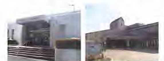
豊ヶ丘図書館 聖ヶ丘図書館