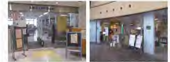
関戸図書館 永山図書館

「開いてて、良かった！」 駅前の立地を活かして、夜間開館や自動貸出・予約受取など、手早く便利なサービスに重点を置いて検討を進めます。