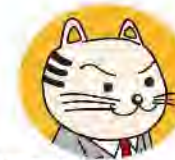
多摩市職員 ニヤンとも TAMA 三郎

市の公共施設のうち約2割の施設が、平成39年度までに大規模改修の時期である築30年を迎えるんだ。