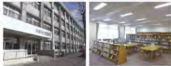
現在の図書館本館 (旧西落合中学校跡地)

「調べ物なら、本館へ！」 全市図書館システムの中核機能と、より広く深い専門的サービスを担える中央館機能の構築を検討します。 併せてパルテノン多摩との機能や事業の連携を進めます。