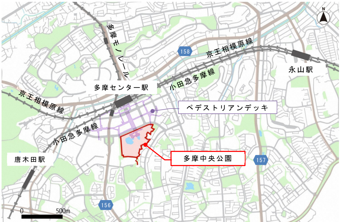
図 1-1 多摩中央公園 位置図