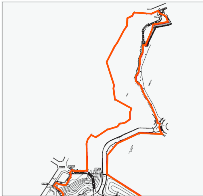
南側緑地平面図 (A1 1:1500)