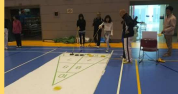
〈参考事例〉 ニュースポーツ体験教室