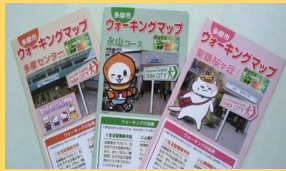
〈参考事例〉 遊歩道を活用した