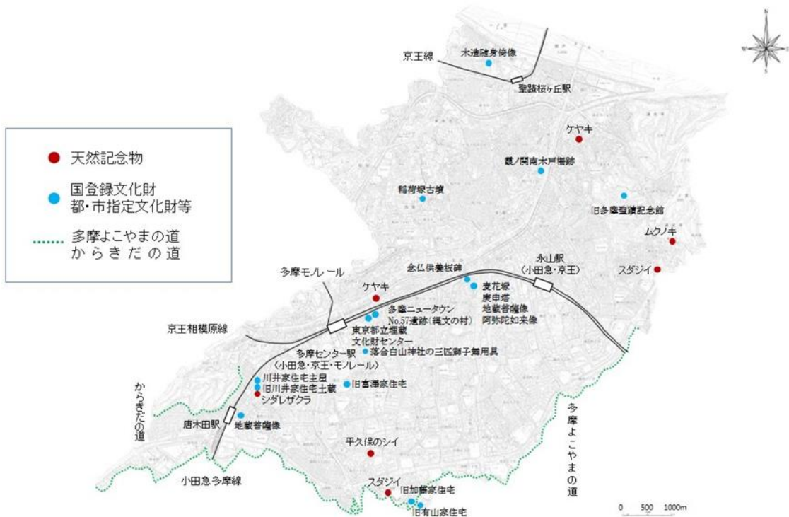
この地図は、東京都知事の承認を受けて、東京都縮尺 2,500 分の 1 地形図を利用して作成したものである。 (承認番号) 2 都市基交著第 161 号