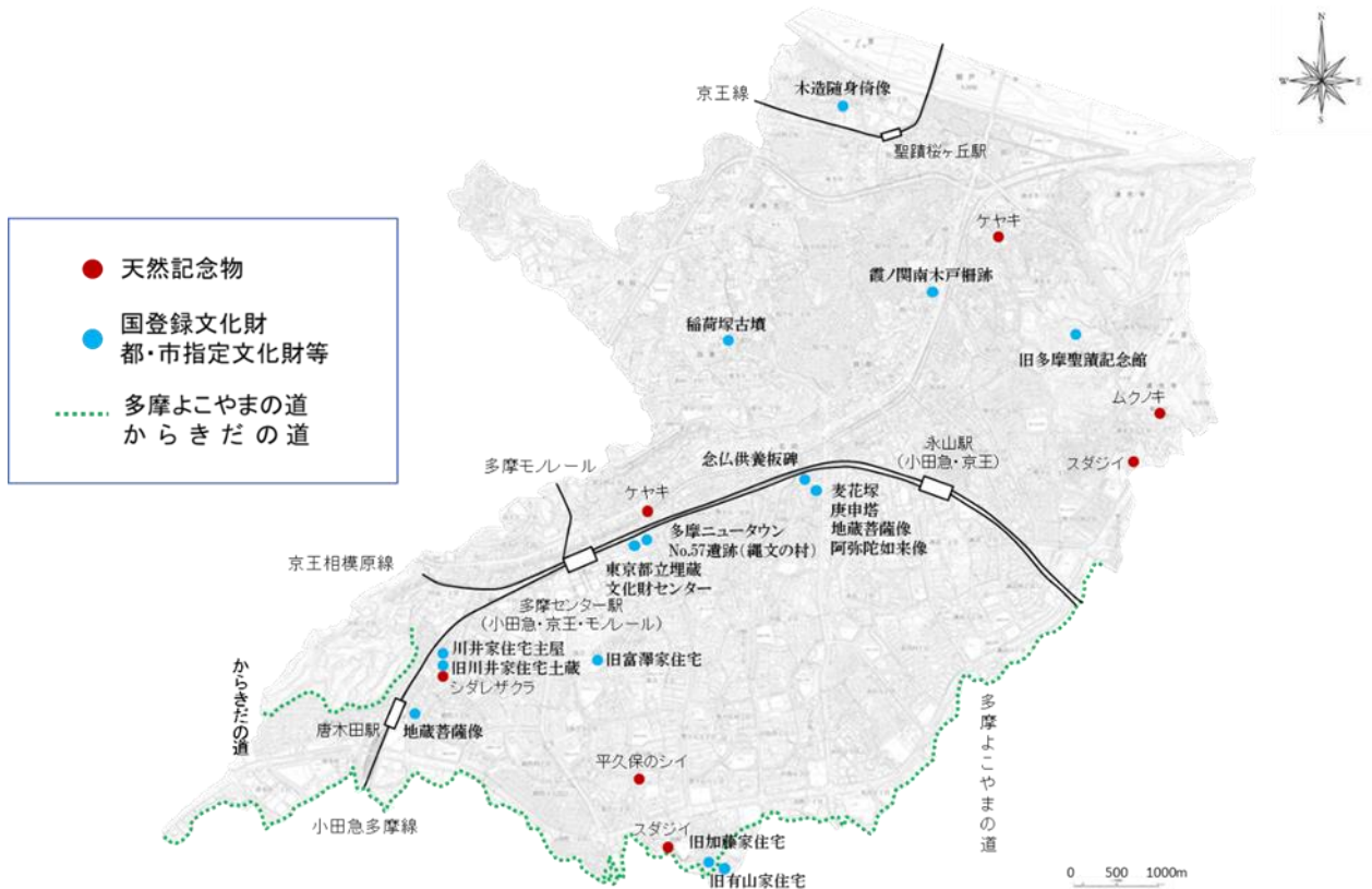
この地図は、東京都知事の承認を受けて、東京都縮尺 2,500 分の 1 地形図を利用して作成したものである。 (承認番号) 2 都市基文著第 161 号