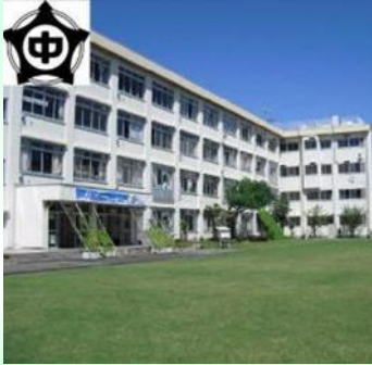
東愛宕中学校（校舎・中庭）