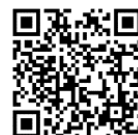
▲ 資料は こちらから