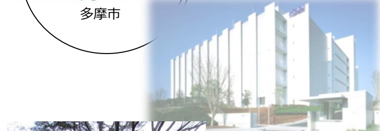
立地企業イメージ