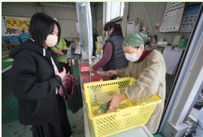
▲楽しく新鮮なお買い物