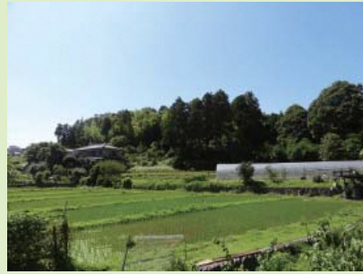
③原峰公園及び市役所周辺拠点