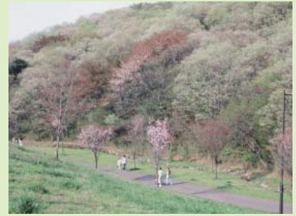
④都立桜ヶ丘公園周辺拠点