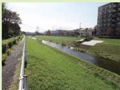
⑧大栗川沿い連携軸