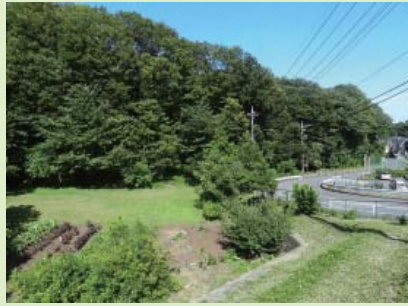
①日野市境周辺拠点