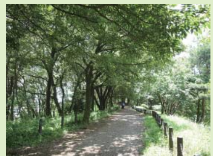
⑪よこやまの道広域連携軸