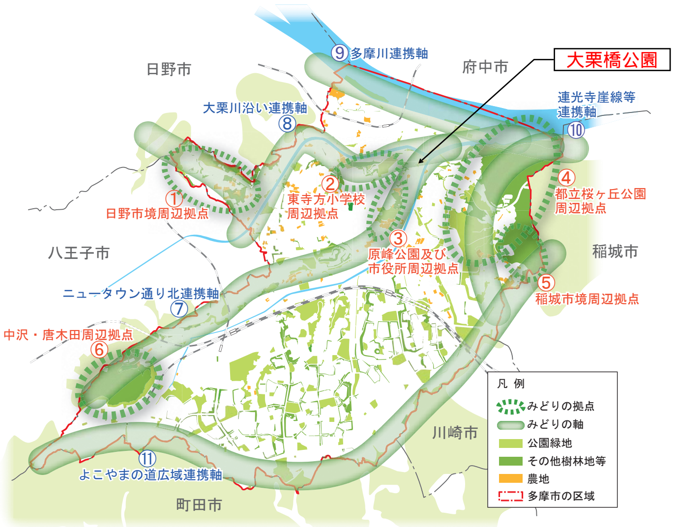
図 3-1 みどりの拠点と軸の位置図