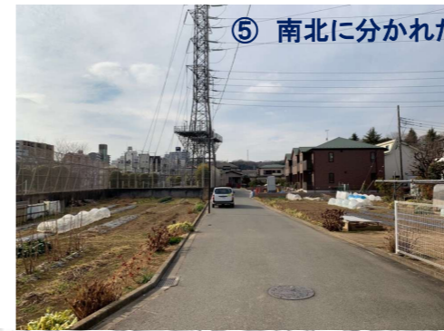
⑤ 南北に分かれた生産緑地