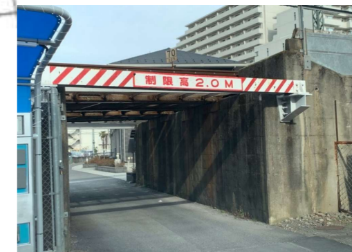
① 京王線(高架) 桁下2m

⑨、⑩、⑪ (京王線から撮影) 都市計画マスタープランにより、 低未利用地の有効利用の促進を 位置付けている場所