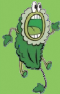
多摩市ユネスコスクール イメージキャラクター 「ゴーヤン」